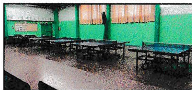
La salle Michelet est une salle de dimension réduite dédiée au club.