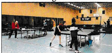
Le plateau de cette vaste salle municipale est occupé pour les besoins des compétitions FFTT et de la « section jeunes »

Affiliation : le club est affilié à deux fédérations : FFTT et UFOLEP